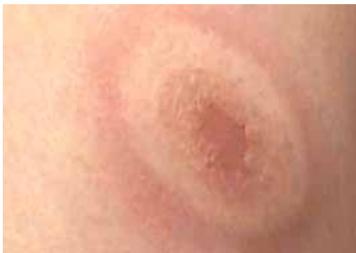
Bild 2 Typische Hautrötung im Frühstadium der Borreliose.

Die Haut zeigt grossflächige Veränderungen (Verdünnung und rot-violette Verfärbung), selten sind auch das Nervensystem oder Gelenke von chronischen Veränderungen betroffen.