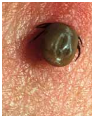
Bild 4 Zecke entfernen: Zecke direkt über der Haut mit Pinzette oder spezieller Zeckenzange fassen und senkrecht zur Hautoberfläche herausziehen. Stichstelle desinfizieren.