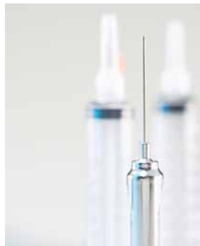
Bild 5 Die Impfung gegen FSME bietet sehr guten Schutz.